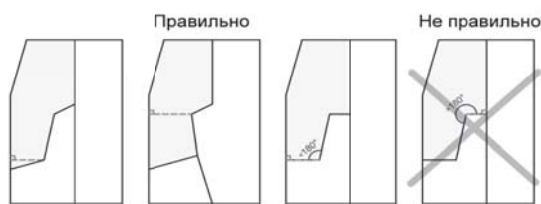
Рис. 1. Варианты определения минимального линейного размера (минимальной ширины) земельного участка

минимальный линейный размер (минимальная ширина) земельного участка – наименьший для данного участка перпендикуляр, опущенный из вершины любого угла земельного участка на его противоположенную сторону. Минимальный линейный размер (минимальная ширина) может совпадать с одной из сторон земельного участка в случае, если она является наименьшим перпендикуляром, опущенным из вершины угла величиной не более 180 градусов (рис. 1);